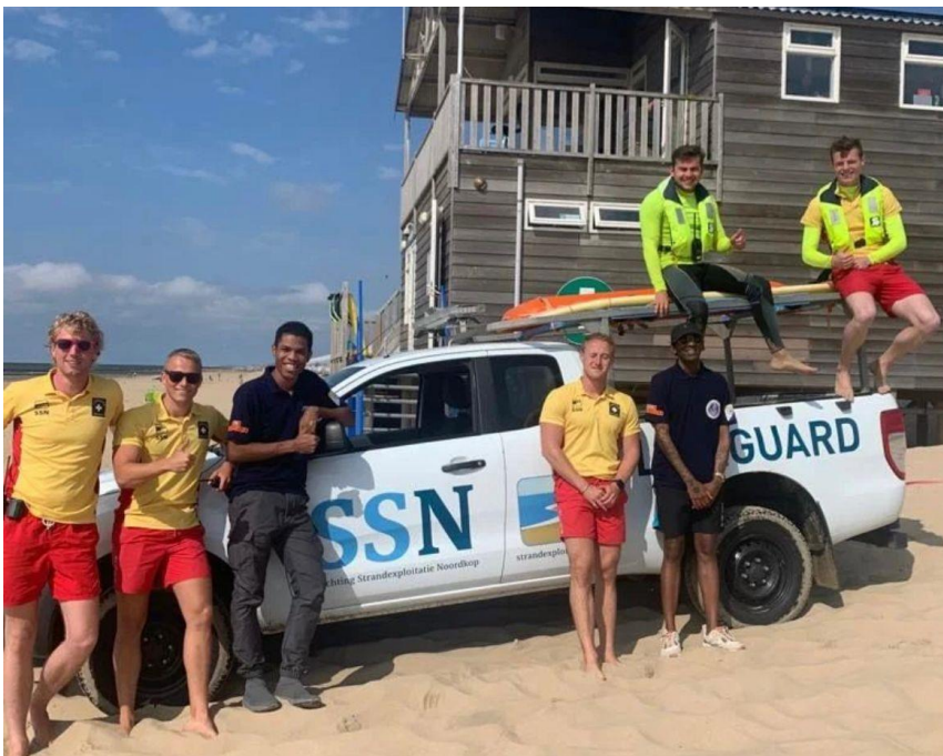
Samen met de SSN Lifeguards

We denken dat we veel van deze organisatie kunnen leren op het gebied van preventie, daarom willen wij in de toekomst werken aan onze samenwerking om zo kennisdeling mogelijk te maken.