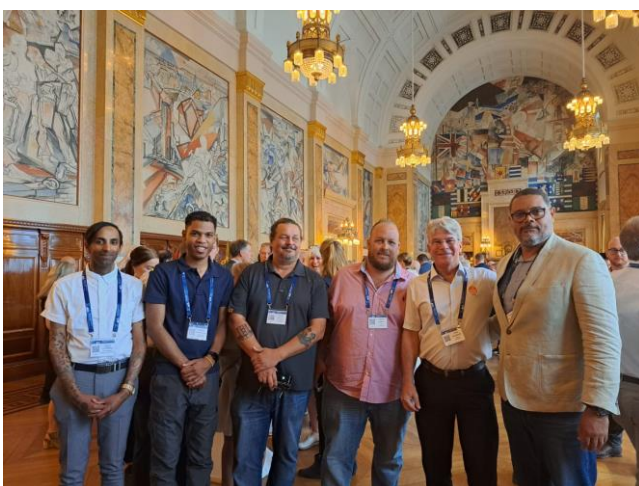
Samen met vertegenwoordigers van de eilanden, Curacao en Sint Maarten

Citro Bonaire heeft de kaarten voor deze bijzondere dagen gedoneerd gekregen van het KNRM. We hebben veel workshops bijgewoond en hebben deze dagen veel geleerd. Wij danken de KNRM en het IMRF voor deze mooie ervaring.