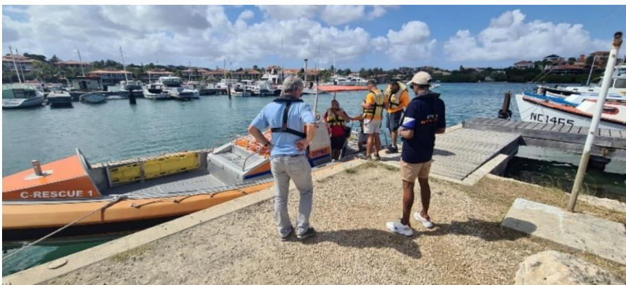
Op bezoek bij CITRO Curacao

We waren te gast bij CITRO Curacao om kennis te maken. We hebben deze dag veel geleerd over de werkwijze van CITRO curacao en hun organisatie. CITRO Curacao bestaat bijna 50 jaar. En telt meer dan 40 vrijwilligers die zich inzetten voor het redden van mens leven in de wateren van Curacao.